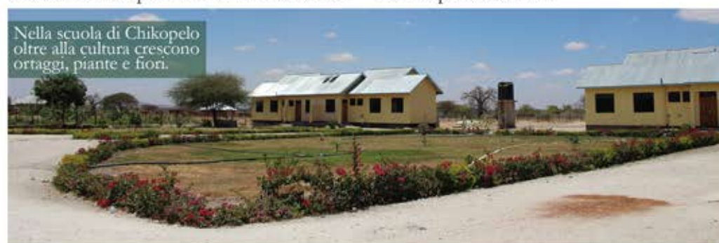
Nella scuola di Chikopelo oltre alla cultura crescono ortaggi, piante e fiori.

Con la realizzazione del muro perimetrale e degli ultimi annessi la scuola potrà essere operativa al 100% offrendo un'istruzione di qualità come emerge dai dati scolastici nazionali, ma anche un futuro professionale.